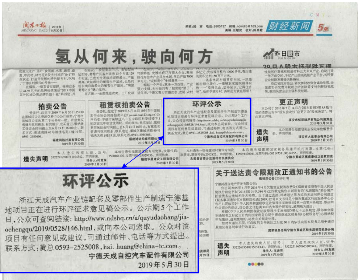
图2 征求意见稿报纸公示 (2019.5.30)