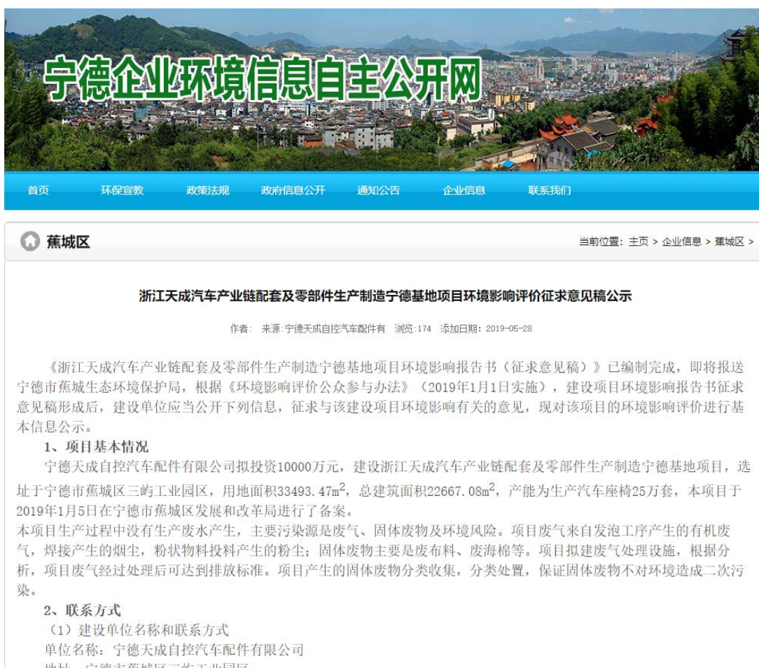
图1 征求意见稿网站公示