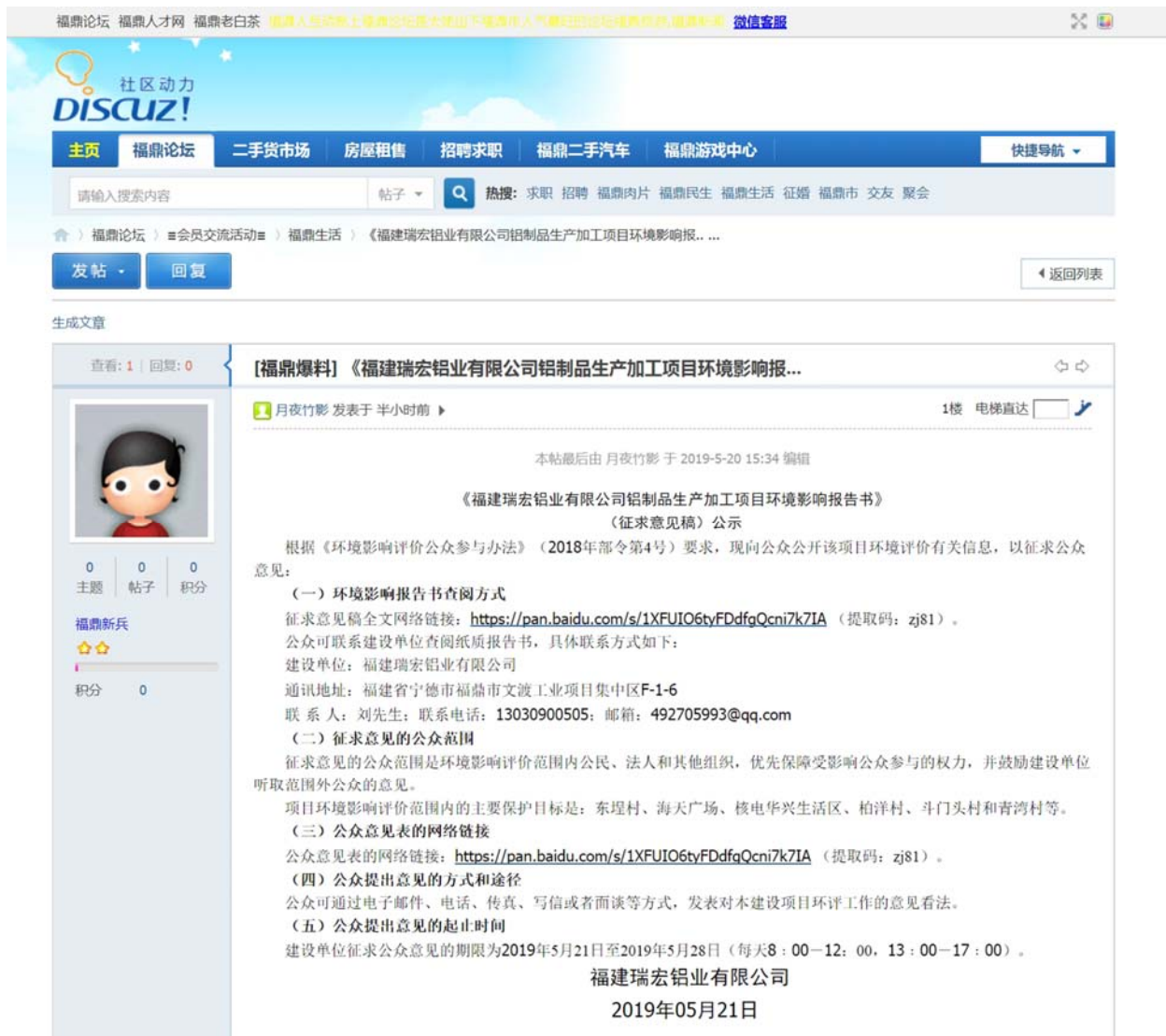
图 3.2-1 第二次环评网络信息公示截图